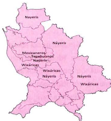
Mapa 2. Zonas en las que habitan las comunidades indígenas en Nayarit.