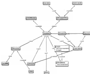
Gráfico 3.- Red primaria de relaciones

El mapa de relaciones primario y que dio sentido al análisis es el siguiente: