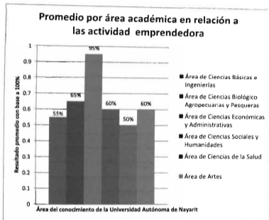
Gráfico 2.- Resultados instrumento 2- Promedio por área de elementos curriculares y actividades sobre emprendimiento

Posteriormente se procedió a sacar un promedio de cada una de las carreras seleccionadas y posteriormente un promedio por área, el resultado se aprecia en la siguiente gráfica: