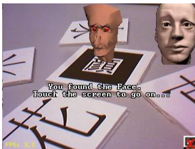
Fig. 1. Software educativo RA para aprender Kanji.

La RA es un tópico que ha despertado el interés de muchas personas y más en el campo de la educación, ya que por ser tan novedoso resulta atractivo para los estudiantes porque representa una nueva forma de aprender por medio de otra tecnología. En el año 2003 se desarrolló un software educativo con RA para aprender Kanji donde se utilizó RA colaborativo, es decir dos jugadores equipados de un PDA con cámara y conexión inalámbrica cada usuario, jugando como oponentes con 10 tarjetas que contienen las marcas que desplegarán el significado de cada símbolo, como se muestra en la Fig. 1. El PDA muestra un icono del vocabulario Kanji que el usuario debe encontrar. Cuando el jugador voltea la carta, el PDA muestra su objeto 3D correspondiente. Si el usuario escoge la carta correcta, obtiene un punto. De esta manera, se empieza a desarrollar software educativo que mezcla el juego con el aprendizaje [5].