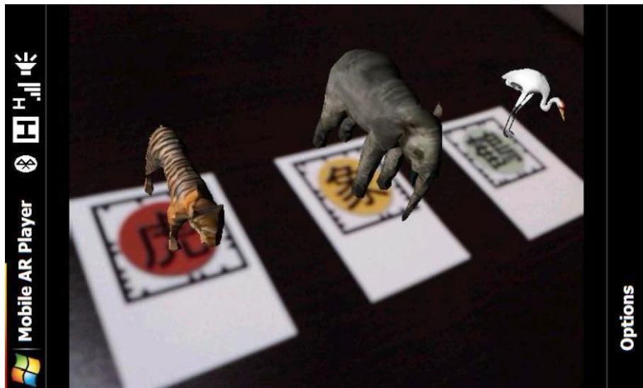
Fig. 2. Animales en peligro de extinción.

Un ejemplo de lo anterior es el juego desarrollado en RA para buscar y aprender acerca de los animales en peligro de extinción en una manera divertida, utilizando cubos como interfaz de usuario, como se muestra en la Fig. 2. Para probar este sistema se dividió un grupo de niños en 2 partes, en la cual, la primera parte jugaría con el juego real, posteriormente, con el virtual y el otro grupo haría lo inverso. El resultado mostrado fue que los niños consideran que el juego real es más fácil de usar que el virtual, pero disfrutaron y se divirtieron más jugando con el virtual. Lo que nos demuestra que falta desarrollar la parte de la usabilidad en la RA debido a que los dispositivos ofrecen interfaces de usuario limitadas [6].