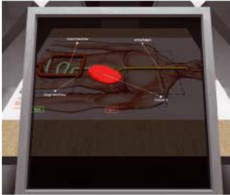
Fig. 3. Aparatos digestivo y circulatorio.

La RA permite, por ejemplo, visualizar monumentos o edificios en 3D, pudiendo ser recorridos e inspeccionados en detalle. También se puede aplicar en ambientes exteriores, mediante móviles, brindándole al usuario reconstrucciones virtuales de construcciones en ruinas, completando así los faltantes y mostrando en la pantalla el original en el entorno actual. También podemos añadir información adicional e interactiva a las propias construcciones. De esta forma, el dispositivo mostraría en la pantalla información adicional, imágenes del interior, audios explicativos, etc.