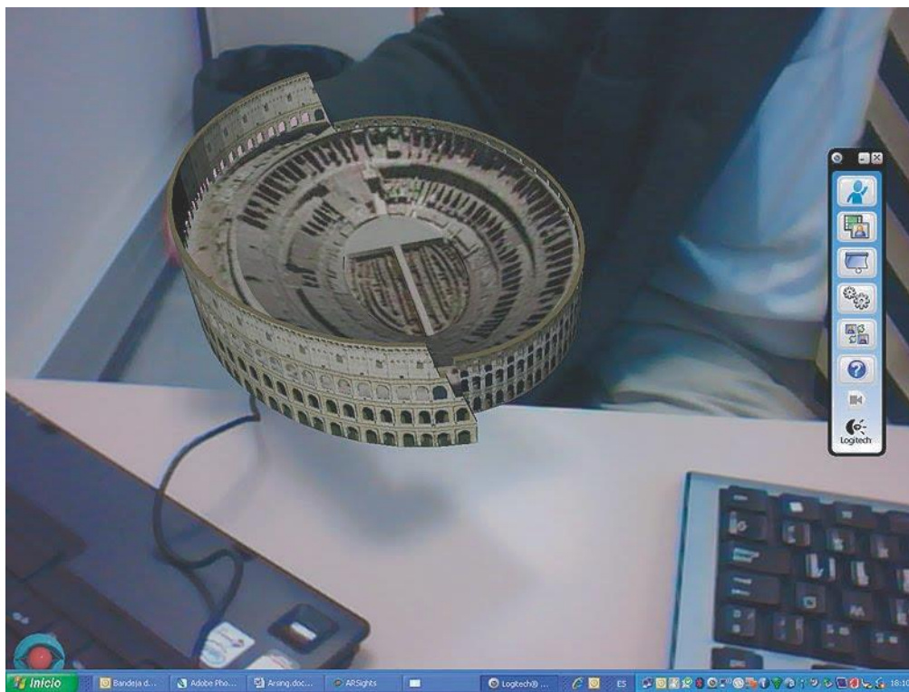
Fig. 4. Aplicación ARsight para Google Earth.

A nivel superior, en las carreras relacionadas a las ingenierías es común que los estudiantes tengan que aprender la interacción entre dos campos magnéticos visualizándolo de manera bidimensional, tema que es conceptualmente exigente ya que se pueden presentar dificultades en la comprensión de algunos conceptos básicos. Los estudiantes deben entender y visualizar lo que está sucediendo realmente en el campo magnético en un espacio de tres dimensiones. Parece común que muchos estudiantes, al término del curso tengan una débil comprensión de los conceptos básicos. En algunos casos, la materia es impartida por medio de diagramas, pero la atención del alumno se suele dividir entre las explicaciones y los elementos visuales a lo que se conoce como “atención dividida” [8], por lo cual se debe reducir este factor mediante el uso de animaciones combinadas con instrucciones apropiadas dentro del mismo esquema.