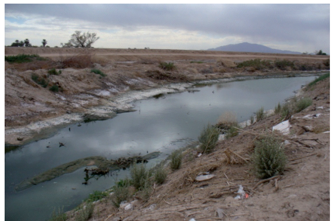
Figura 1. Vista de un dren agrícola con aportes urbanos y presencia de residuos sólidos.

However, agricultural drains are also collectors of urban discharges of small and often mid-sized rural communities and nearby cities, as well as wastewaters resulting from washing septic tanks and containers of pesticides and other toxic chemicals (Figure 1).