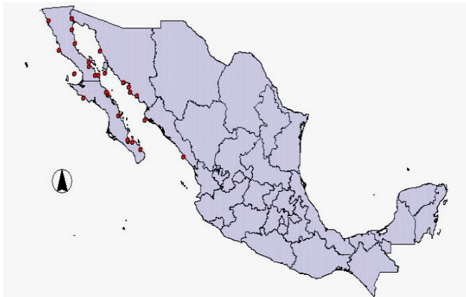
Figura 2. Estaciones de colecta del Laboratorio de Ciencias Ambientales del CIAD en la costa del Golfo de California.