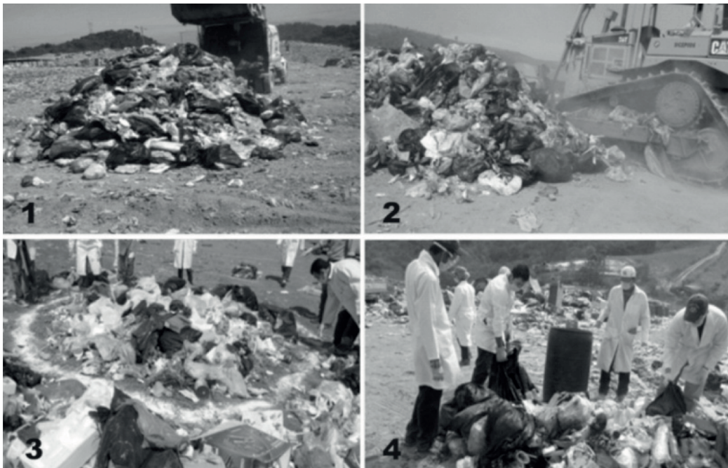
Fig. 1. Cuarteo y toma de la muestra de la mezcla de los residuos de la ruta seleccionada en el vertedero el Iztete en Tepic

Se seleccionó una muestra representativa para la caracterización por el método de cuarteo según la Norma Oficial Mexicana NOM-AA-015 (SECOFI 1985a). La muestra total para cuarteo fue de 8000 kg y la muestra para caracterización fue de 52.5 kg. De la muestra para caracterización se seleccionaron los subproductos de acuerdo con la clasificación de Gallardo et al. (2006). La muestra obtenida en el sitio se trasladó a los espacios de la Universidad Autónoma de Nayarit y sobre una superficie limpia y cubierta con bolsas de polietileno se procedió a la clasificación física. Se realizaron diferentes cribados y los residuos se clasificaron en categorías, se describieron cada uno de los componentes individuales que constituyen la muestra de RSU en masa, y su distribución relativa en porcentajes en peso (ver figuras 1 y 2 ).