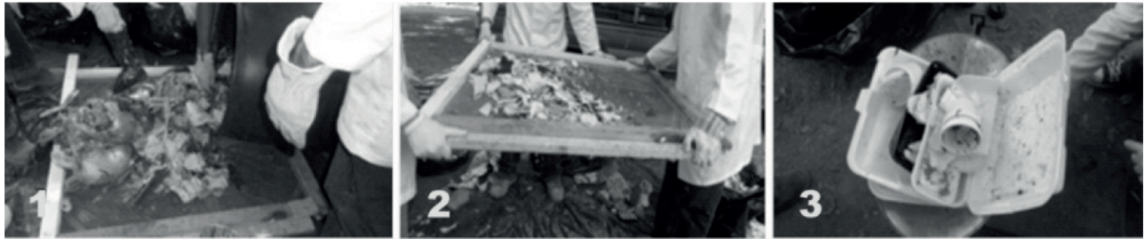
Fig. 2. Proceso para la determinación de la caracterización física de los RSU en Tepic

La estimación del peso específico total de los RSU se obtuvo por la NMX-AA-019 (SECOFI 1985 II), utilizando la ecuación (1).