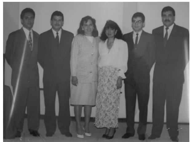
Imagen 7. Primera generación de la División de Estudios de Posgrado e Investigación (Odontopediatría)

Una parte fundamental en la búsqueda de la excelencia académica es el contar con una plantilla de profesores altamente capacitados tanto en el ejercicio docente como en la investigación. Para alcanzar la calidad se requiere que el proceso enseñanza-aprendizaje se apoye en la investigación o en la capacitación a través de la práctica profesional. La investigación es parte sustancial del quehacer universitario y por lo tanto, complemento esencial del ejercicio docente, por esto la docencia se vincula a la investigación de manera tal que estimule la capacidad creadora de los profesores e induzca a los alumnos en la disciplina del método científico. 8