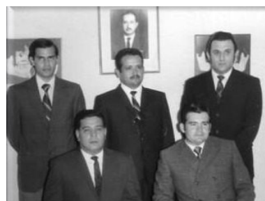
Imagen 5. Docentes fundadores de la Escuela de Odontología.