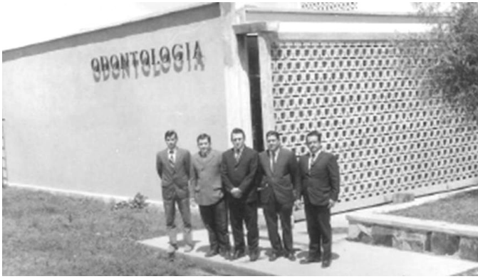
Imagen 6. Inicio de actividades académicas el 2 de Septiembre de 1969.

En sus inicios la Escuela de Odontología trabajó con una réplica del plan de estudios de la Universidad de Guadalajara, que estuvo vigente por un lapso de 20 años; ya que en el año de 1989, es aprobado un nuevo plan de estudios el cual fue estructurado tomando como base planes de estudio de otras universidades, dado que no existía una real evaluación ni de los contextos sociales, ni de los problemas y mucho menos del sistema educativo que orientara de mejor manera la propuesta curricular de ese entonces.