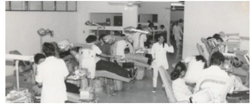
Imagen 4. Clínica Odontológica en 1972.