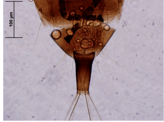
Figura 5. Karnyothrips maurilia n. sp. Detalle de los tergos IX-X del abdomen (holotipo).

Abdomen. — Pelta ancha de color castaño claro y reticulada con dos secciones membranosas laterales y un par de setas mayores en los remanentes laterales del segmento I del abdomen ( 47,5 \mu\text{m} ) y un par accesorio externo de punta aguda muy reducido ( 12,5 \mu\text{m} ). Tergos abdominales II-VI con dos pares de setas retentorias de las alas. Dos pares de setas laterales bien desarrolladas y rectas en los tergos II-VI con la seta interna ( 60,0 \mu\text{m} ) más desarrollada que la externa ( 47,5 \mu\text{m} ). Tergo VII con el par externo de setas de ápice agudo. Tergo VIII con dos pares de setas, ninguna de ápice agudo, la externa ( 77,5 \mu\text{m} ) más desarrollada que la interna ( 62,5 \mu\text{m} ). Tergo IX con setas B1 desarrolladas ( 87,5 \mu\text{m} ), setas B2 y B3 con ápice agudo (B2 = 37,5 \mu\text{m} , B3 = 187,5 \mu\text{m} ). Segmento X ensanchado en el cuarto basal y ligeramente adelgazado después de éste (longitud del segmento X = 100,0 \mu\text{m} ) (Fig. 5). Setas anales 212,5 \mu\text{m} (2,12 veces la longitud del tubo) (Fig. 4).