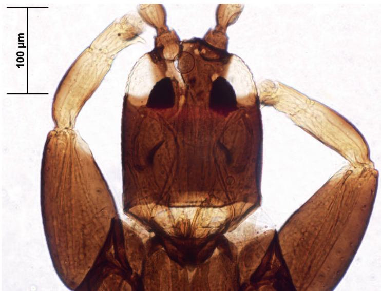
Figura 1. Karnyothrips maurilia n. sp. Vista dorsal de la cabeza (holotipo).

Tórax. — Más ancho que largo, de forma trapecoidal (Fig. 2). Sin ornamentación evidente. Setas anteroangulares bien desarrolladas (37,5 \mu\text{m} ). Setas anteromarginales reducidas