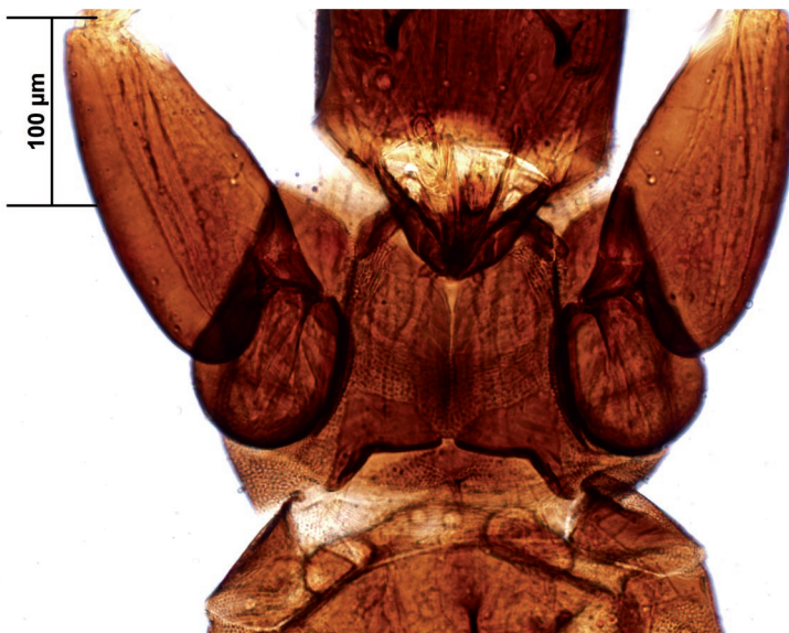
Figura 3. Karnyothrips maurilia n. sp. Detalle de la parte ventral del protórax (holotipo).