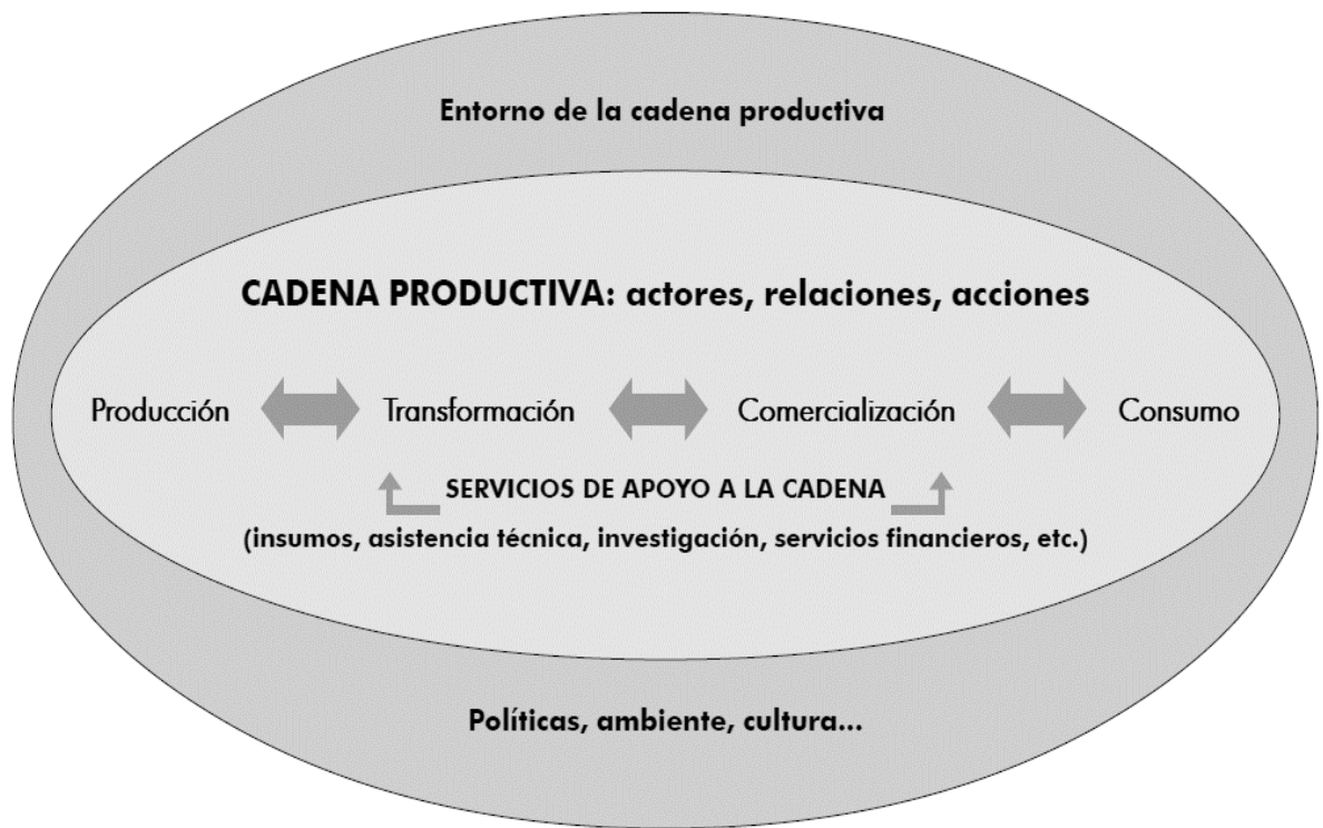
Figura no. 2 La cadena productiva y sus actores.

Según Heyden y Camacho (2004), se presenta un esquema de la cadena productiva y sus actores principales. Véase figura no. 2.