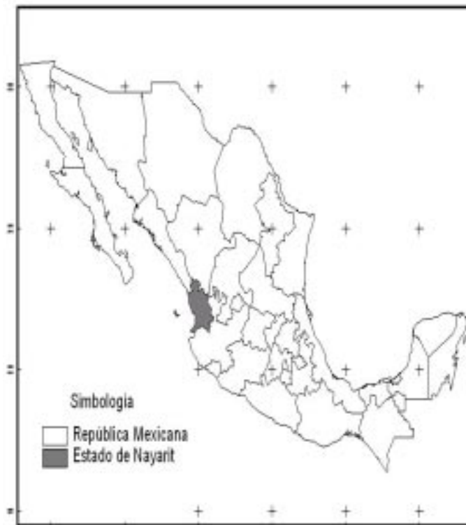
Figura 1. Localización del estado de Nayarit en la República Mexicana